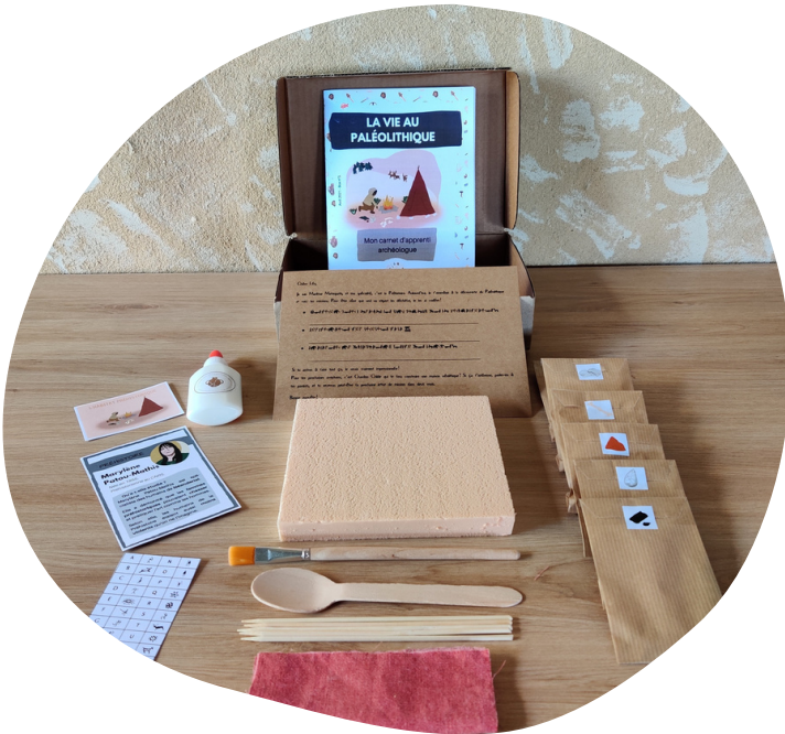
Visuel individuel. Les box scolaires contiennent le matériel pour tous les enfants.