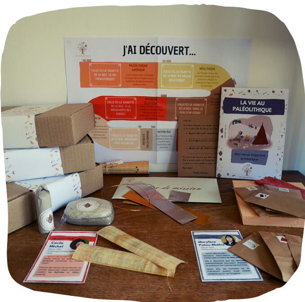
Matériel pédagogique utilisé dans les box.