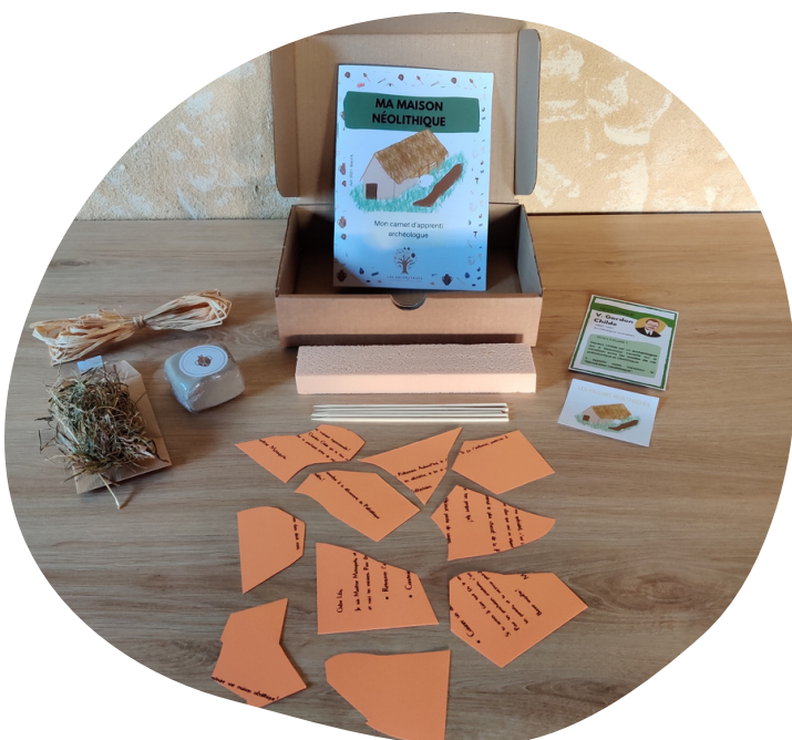
Visuel individuel. Les box scolaires contiennent le matériel pour tous les enfants.